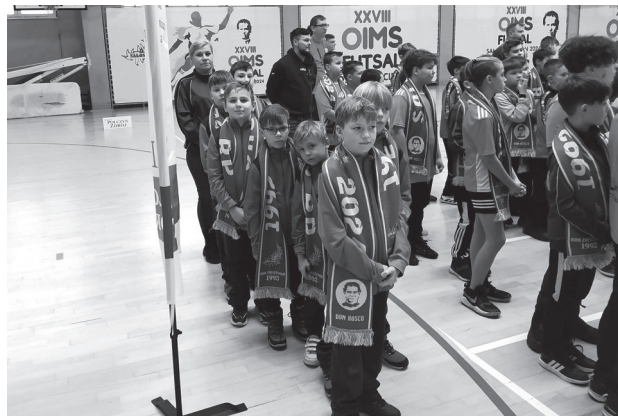
Nasi reprezentanci na ceremonii zakończenia Igrzysk.

Nasza drużyna z rocznika 2009 w „małym finale” o 3 miejsce wygrała 8:2. Młodszy z rocznika 2013 w meczu o 5 miejsce z Elkiem niestety przegrali w rzutach karnych 2:3. Oczywiście na Igrzyskach nie mogło zabraknąć wspólnej Eucharystii, a kolędy śpiewane przez 300 zawodników wywoływały u dorosłych zauważalne wzruszenie. T.G.