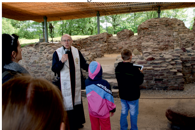
Dzieci I-Komunijne na Ostrowie Lednickim 10.V.2014 r.